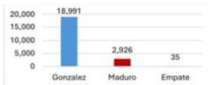
Tabla 3. Resultado de mesas ganadas por candidato, según la base consolidada por la MOE (73% de actas)